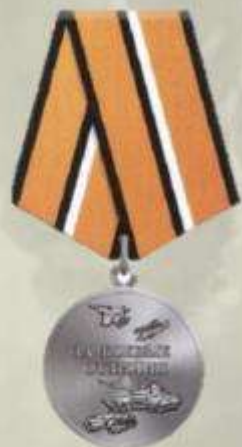
МЕДАЛЬ "ЗА УКРЕПЛЕНИЕ БОЕВОГО СОДРУЖЕСТВА"